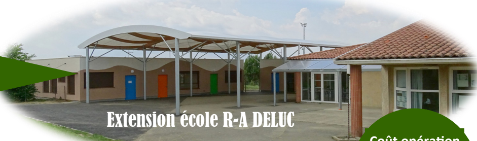
Extension école R-A DELUC

Nos jeunes écoliers ont investi la nouvelle structure le 24 mai ! Une belle réalisation offrant des conditions optimales d'accueil et de fonctionnement.